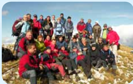
Skupinska slika na vrhu Orjena (mejni hrib med Bosno in Črno goro)

Naslednji dan sta nas lokalna vodnika popeljala v pogorje Orjena, naš cilj sta bila vrhova Vučji zub (1802) in Kabao (1894), najvišji vrh Orjena. Orjen je gorski masiv severo-zahodno od Kotorskega zaliva in je naravna meja med Hercegovino in Črno goro. Značilnost Orjena sta ledeniški in kraški relief in veličastna vegetacija, kot so munike – vrsta lokalnih borovcev. To območje ima tudi največ padavin v Evropi tudi preko 5000 mm v enem letu.