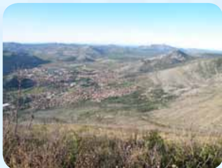
Pogled na Trebinje z Leotarja

Drugi dan našega bivanja v Trebinju smo se povzpeli na Leotar, to je vrh nad Trebinjem. Z vrha je čudovit razgled na mesto in okolico. Zelo lepo se od tod vidijo ostanki trdnjav, ki so bile postavljen po okoliških vzpetinah in so varovale mesto pred napadalci. Mesto je bilo že nekoč bogato. Ker se je veliko ohranilo do danes, je po mestu ogromno zanimivosti, ki so vredne ogleda.