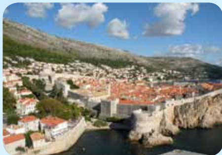
Zadnji dan smo si ogledali še Dubrovnik

prišli istočasno z ogromnima turističnima križarkama. Nepopisna množica nas je kar posesala čez vhodna vrata Dubrovnika in nas povlekla po turističnih poteh.