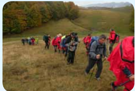
Pot na Bjelašnico

Naslednji dan je bil v načrtu vzpon na Bjelašnico (2067). Zbudili smo se v deževno jutro in tudi napoved ni bila obetavna, vendar smo se vseeno z avtobusom odpeljali do vznožja gore. Dež je vztrajno padal, zato je bila planinska kočica Bjele vode kot naročena.