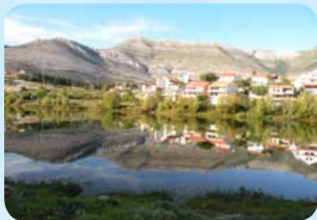
Trebinje v ozadju Leotar

Mesto je zelo ponosno na Arslanagičev ali Perovičev most, ki je arhitekturni biser in veličasten zgled otomanske gradnje kamnitih mostov iz 16. stoletja. Ta most je bil višje ob reki in je bil ob zajezitvi potopljen, kasneje ob praznjenju jezera pa so ga razstavili in ponovno sestavili na sedanjem mestu nižje ob reki. Na vzpetini nad mestom so leta 2000 postavili popolno kopijo pravoslavnega samostana in cerkve Gračanica s Kosova, kjer je sedaj pokopan srbski pesnik in diplomat Jovan Dučić.