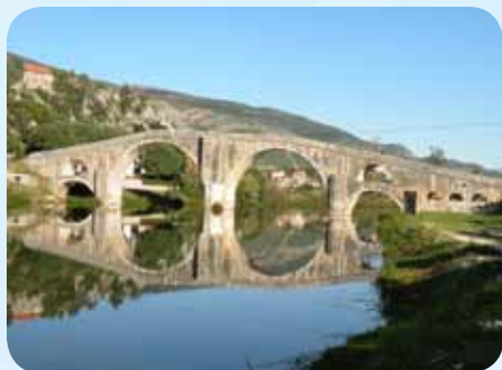
Znameniti Arslanagičev most v Trebinju

Mesto je zelo ponosno na Arslanagičev ali Perovičev most, ki je arhitekturni biser in veličasten zgled otomanske gradnje kamnitih mostov iz 16. stoletja. Ta most je bil višje ob reki in je bil ob zajezitvi potopljen, kasneje ob praznjenju jezera pa so ga razstavili in ponovno sestavili na sedanjem mestu nižje ob reki. Na vzpetini nad mestom so leta 2000 postavili popolno kopijo pravoslavnega samostana in cerkve Gračanica s Kosova, kjer je sedaj pokopan srbski pesnik in diplomat Jovan Dučić.