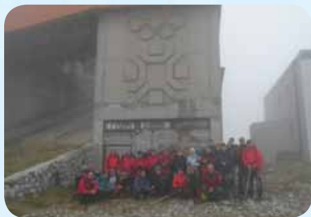
Skupinska slika na vrhu Bjelašnice

Tudi v to kočo ni bil dovoljen vstop v čevljih, zato se je večina zatekla pod zunanjo teraso. Nekateri pa smo se sezuli in vstopili v kočo. V koči je bila skupina domačinov, ki so nas z zanimanjem opazovali, ko smo prepevali. Ob pesmi »Od Vardara pa do Triglava ...« pa so ugotovili, da še imamo nekaj skupnega in so se nam pridružili pri prepevanju. Prava zabava pa se začela, ko je oskrbnica iz kuhinje prinesla harmoniko. Ubrano petje je prepodilo oblake in v daljavi se je iz megle prikazal vrh Bjelašnice. Poslovili smo se od prijaznih gostiteljev in se po položnem južnem travnatem pobočju podali proti vrhu. Na vrhu nas je pozdravila prijazna posadka meteorološke postaje in nas povabila na toplo v svoje prostore. Na vrhu Bjelašnice je bil start moškega olimpijskega smuka. Zapuščena štartna rampa in drugi objekti sedaj propadajo in žalostno čakajo na lepšo prihodnost. V dolino smo se spustili po severni strani, ki je poraščena z gozdovi in prepletena s smučarskimi progami. Pod hribom raste in se razvija veliko turistično naselje. Vsi ti zapuščeni športni objekti bodo kmalu spet zaživeli, saj tereni in naravni pogoji kar kličejo ljubitelje snežnih prostranstev.