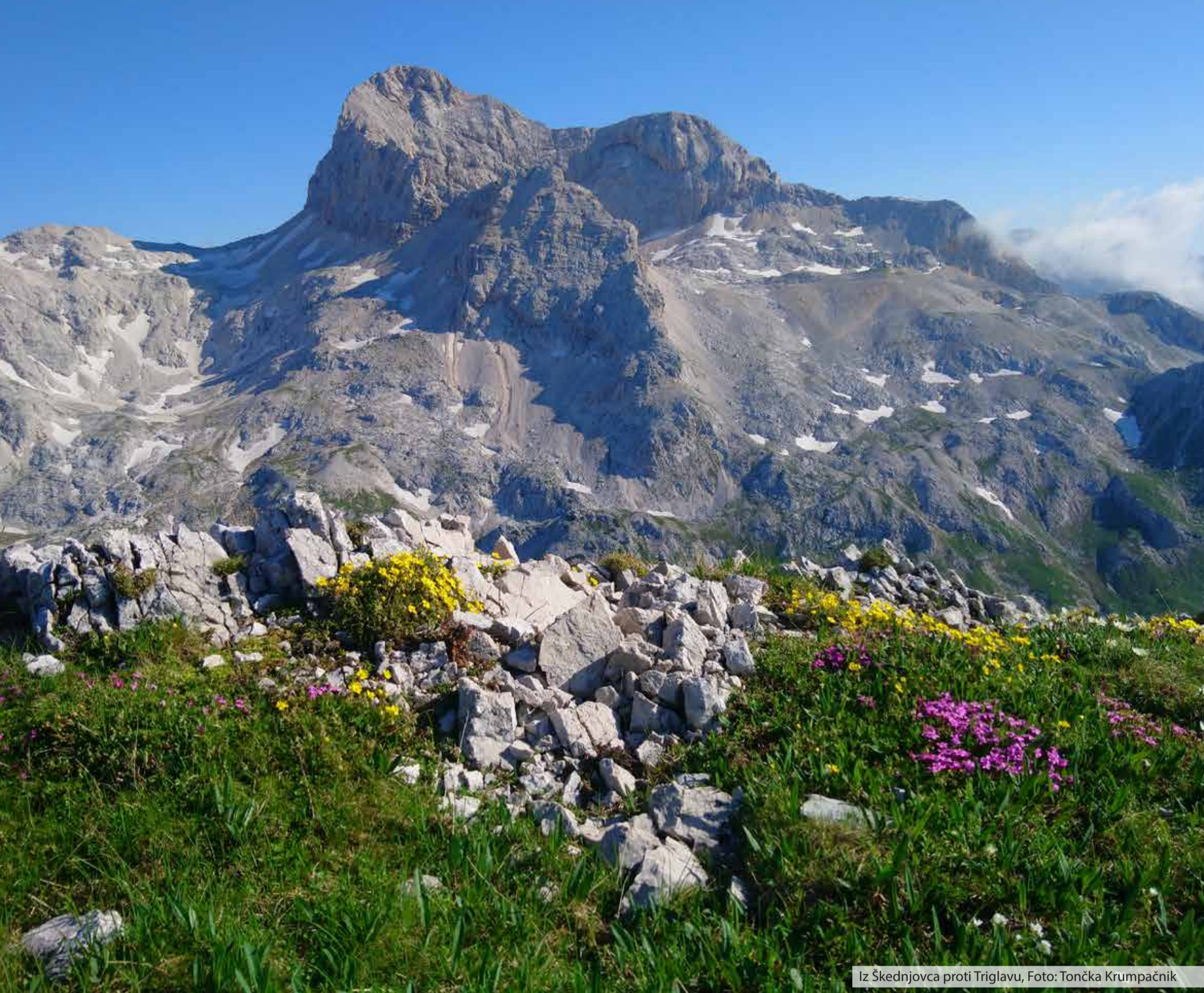
Iz Škednjovca proti Triglavu, Foto: Tončka Krumpačnik