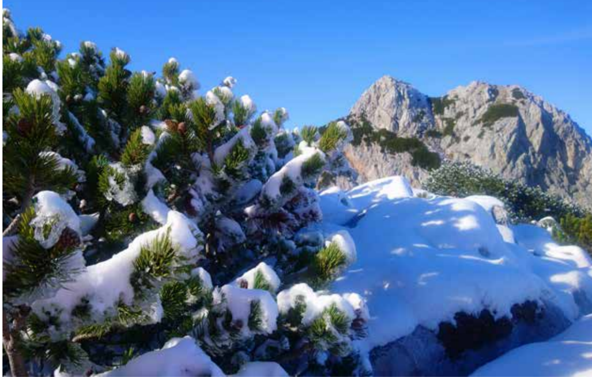
Zimska idila v visokogorju