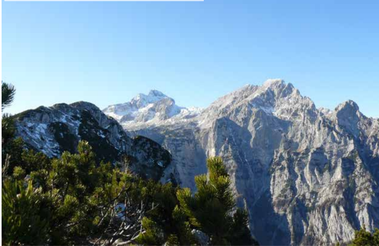
Pogled z Debele peči proti Triglavu