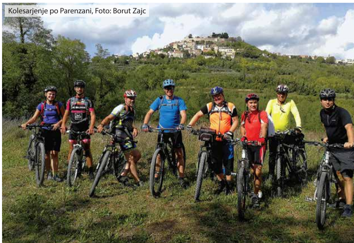
Kolesarjenje po Parenzani