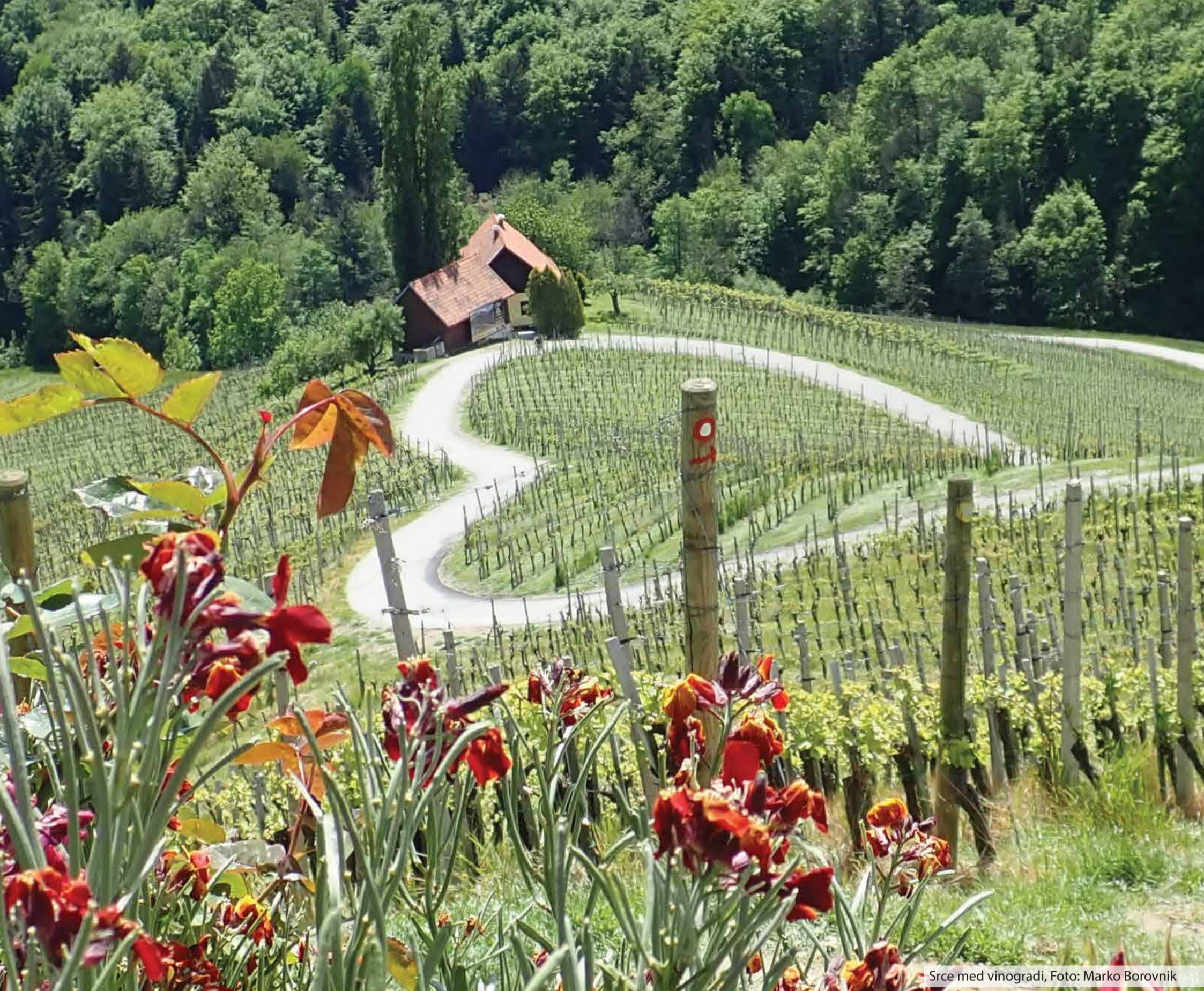
Srce med vinogradi