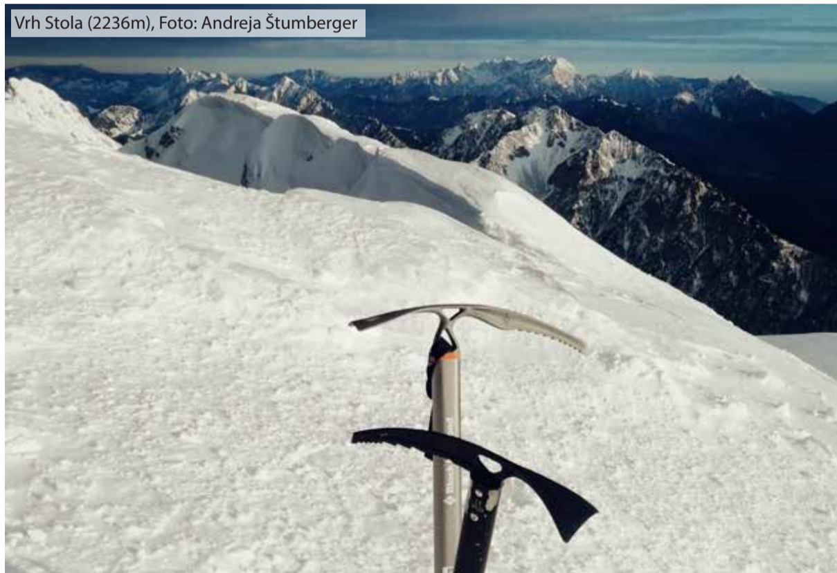
Vrh Stola (2236m)