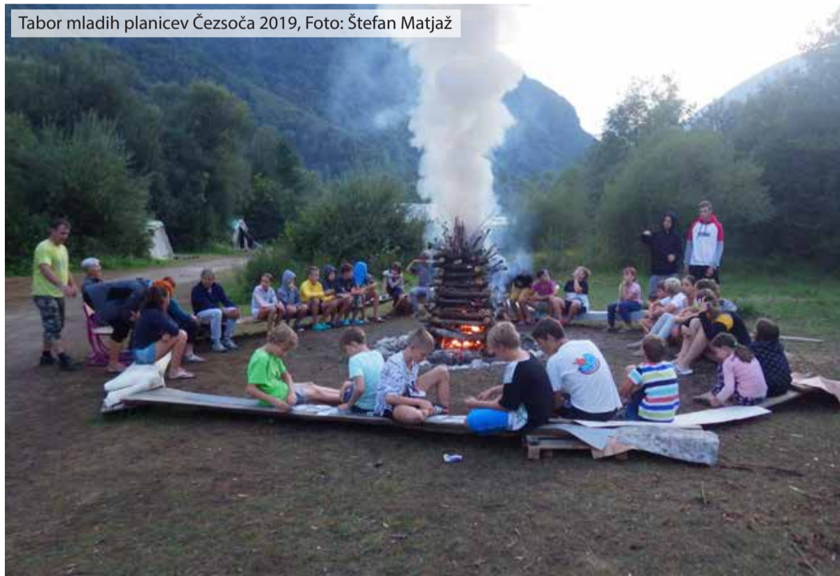
Tabor mladih planincev Čezsoča 2019