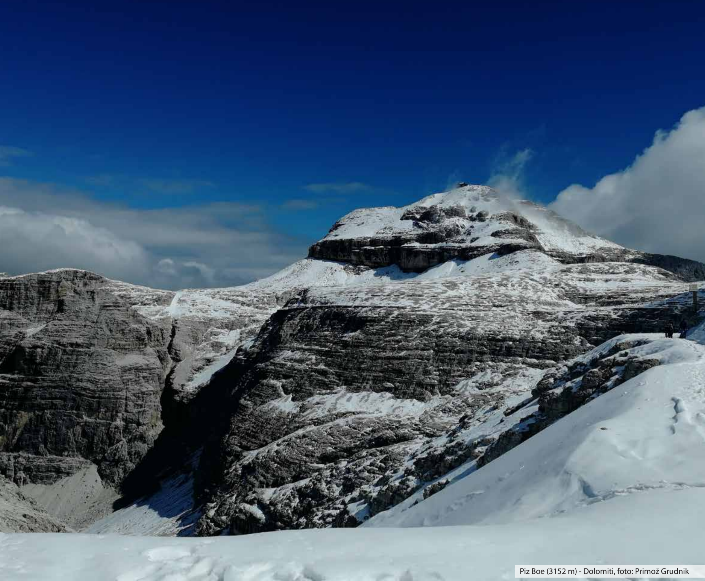
Piz Boe (3152 m) - Dolomiti