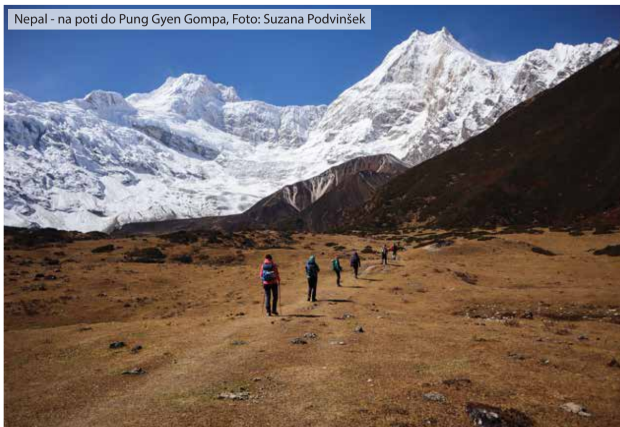
Nepal - na poti do Pung Gyen Gompa

26.12.2020 - Pohod Topolšica – Sleme (1086 m) preko Loma