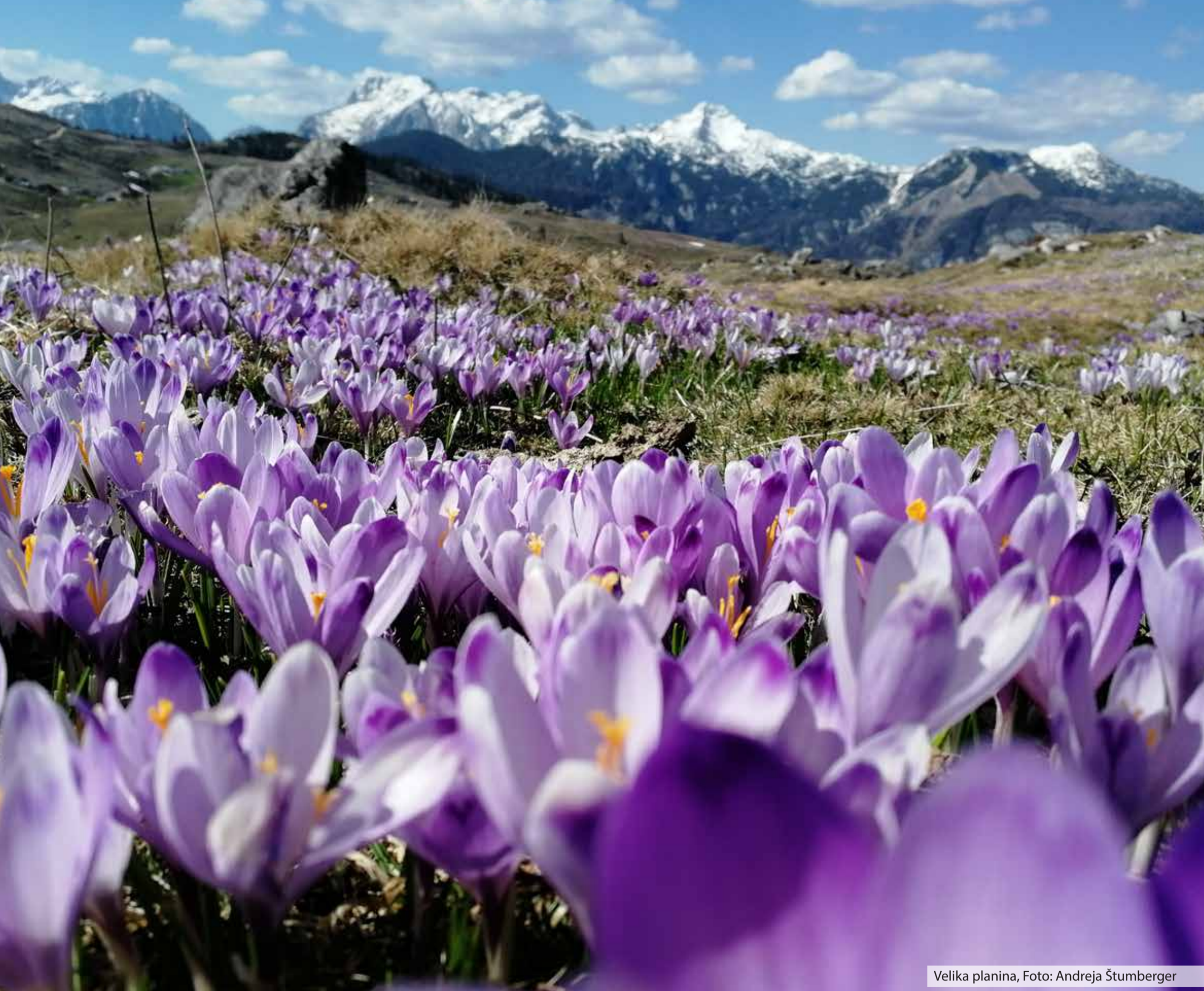
Velika planina