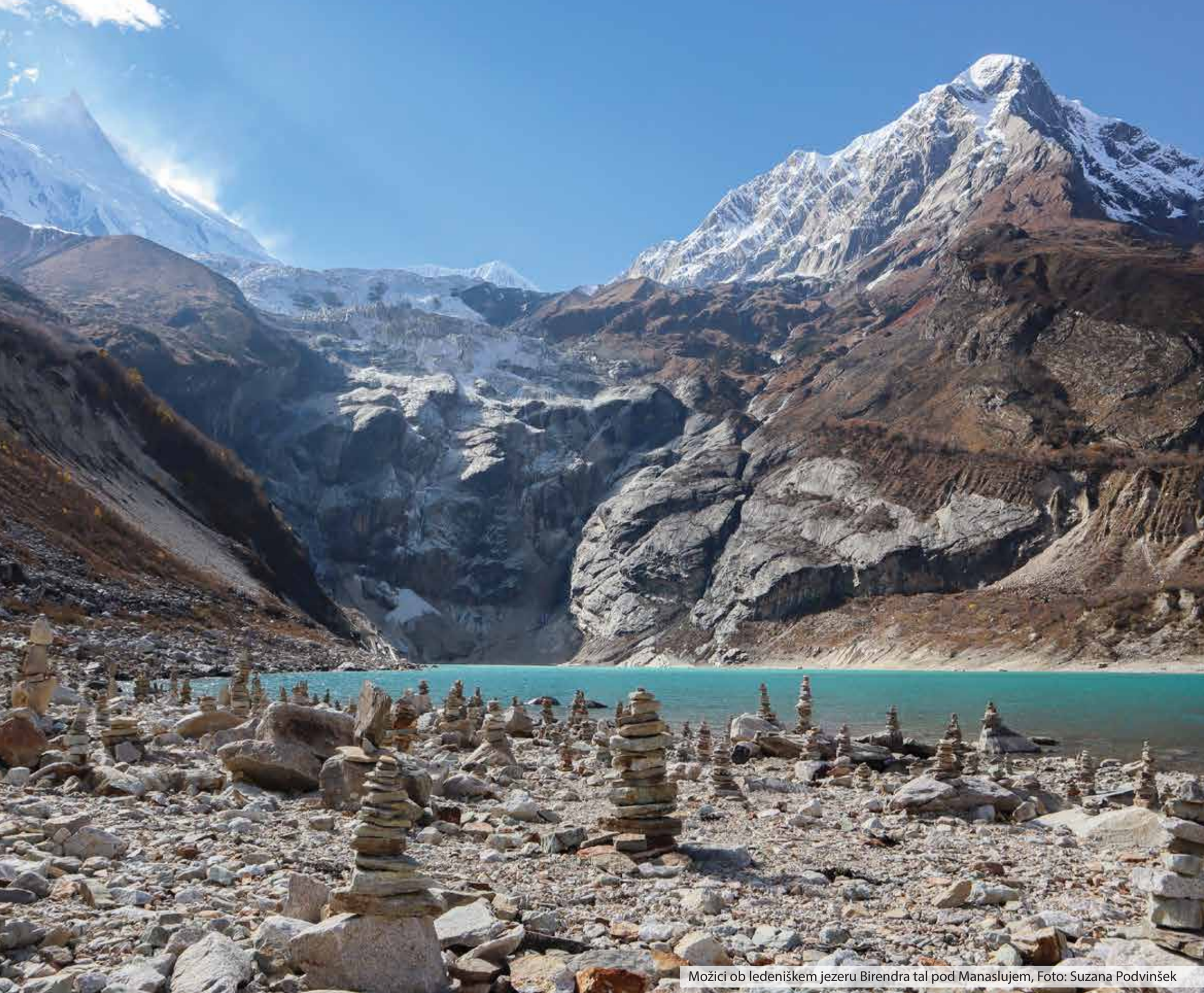
Možici ob ledeniškem jezeru Birendra tal pod Manaslujem