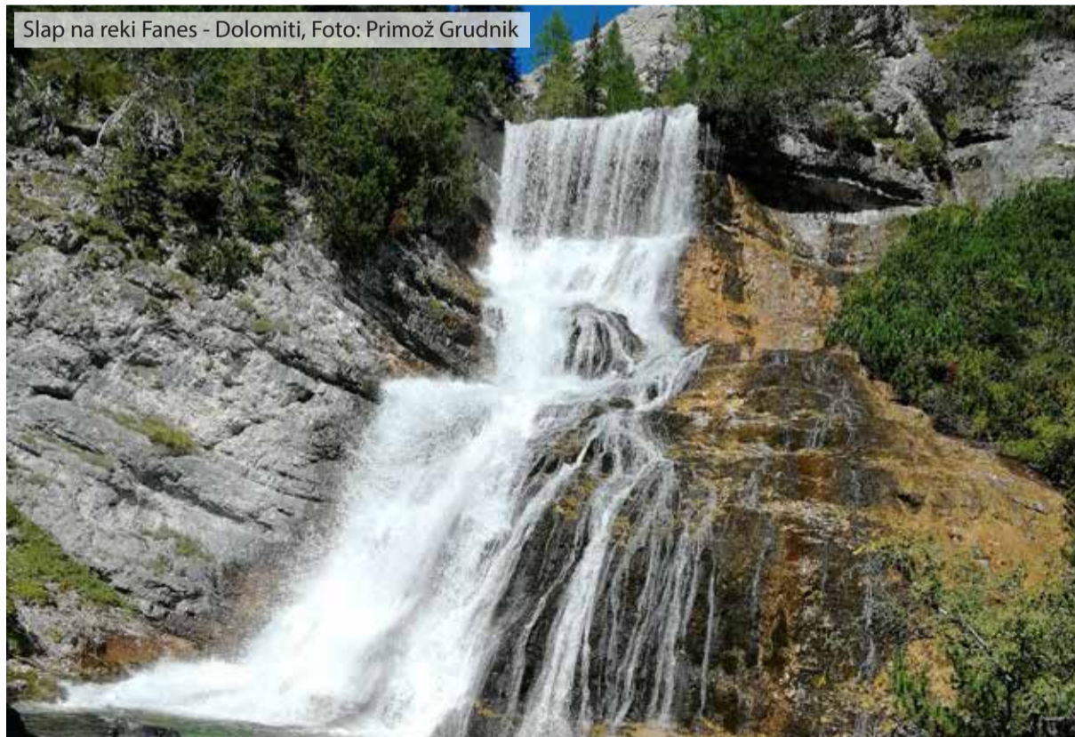
Slap na reki Fanes - Dolomiti, Foto: Primož Grudnik