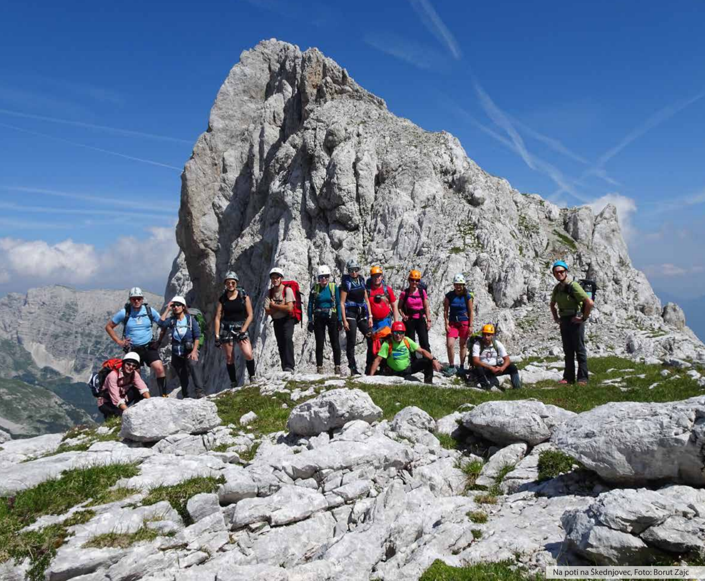
Na poti na Škednjovec