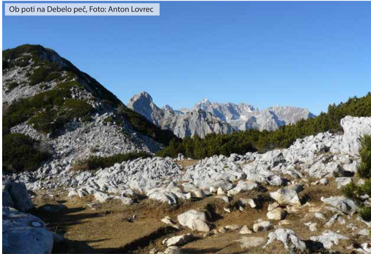
Ob poti na Debelo peč