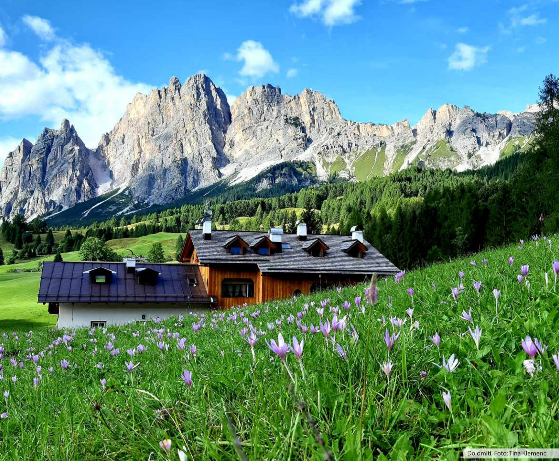
Dolomiti, Foto: Tina Klemenc