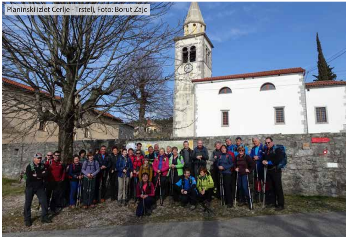
Planinski izlet Cerlje - Trstelj