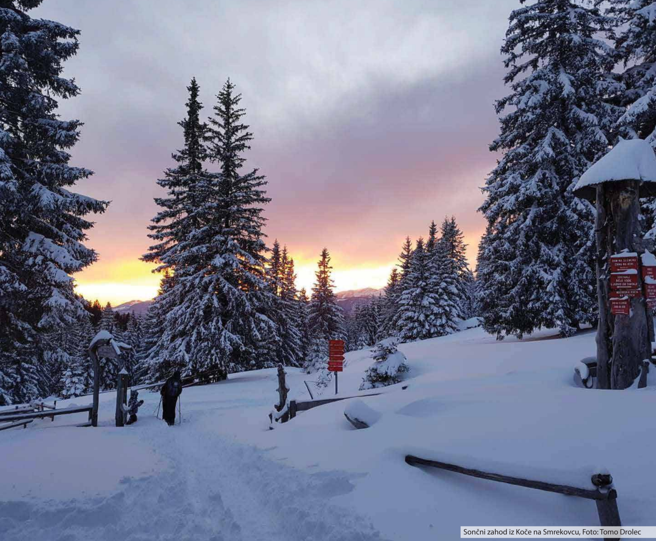
Sončni zahod iz Koče na Smrekovcu