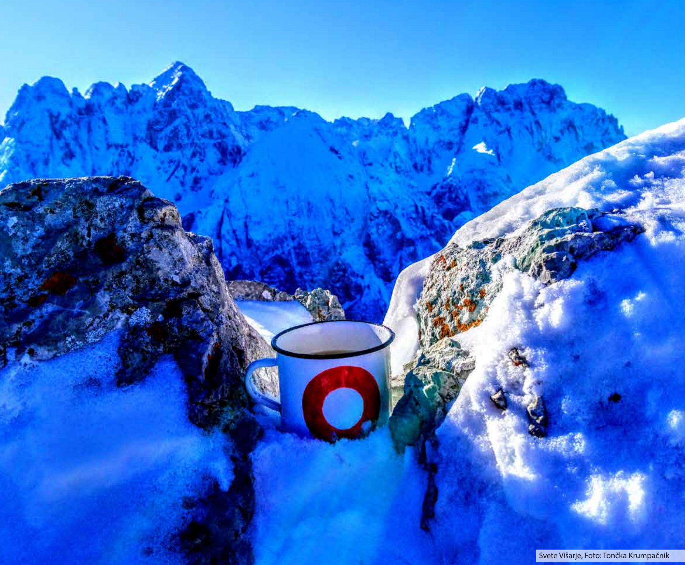
Svete Višarje, Foto: Tončka Krumpačnik