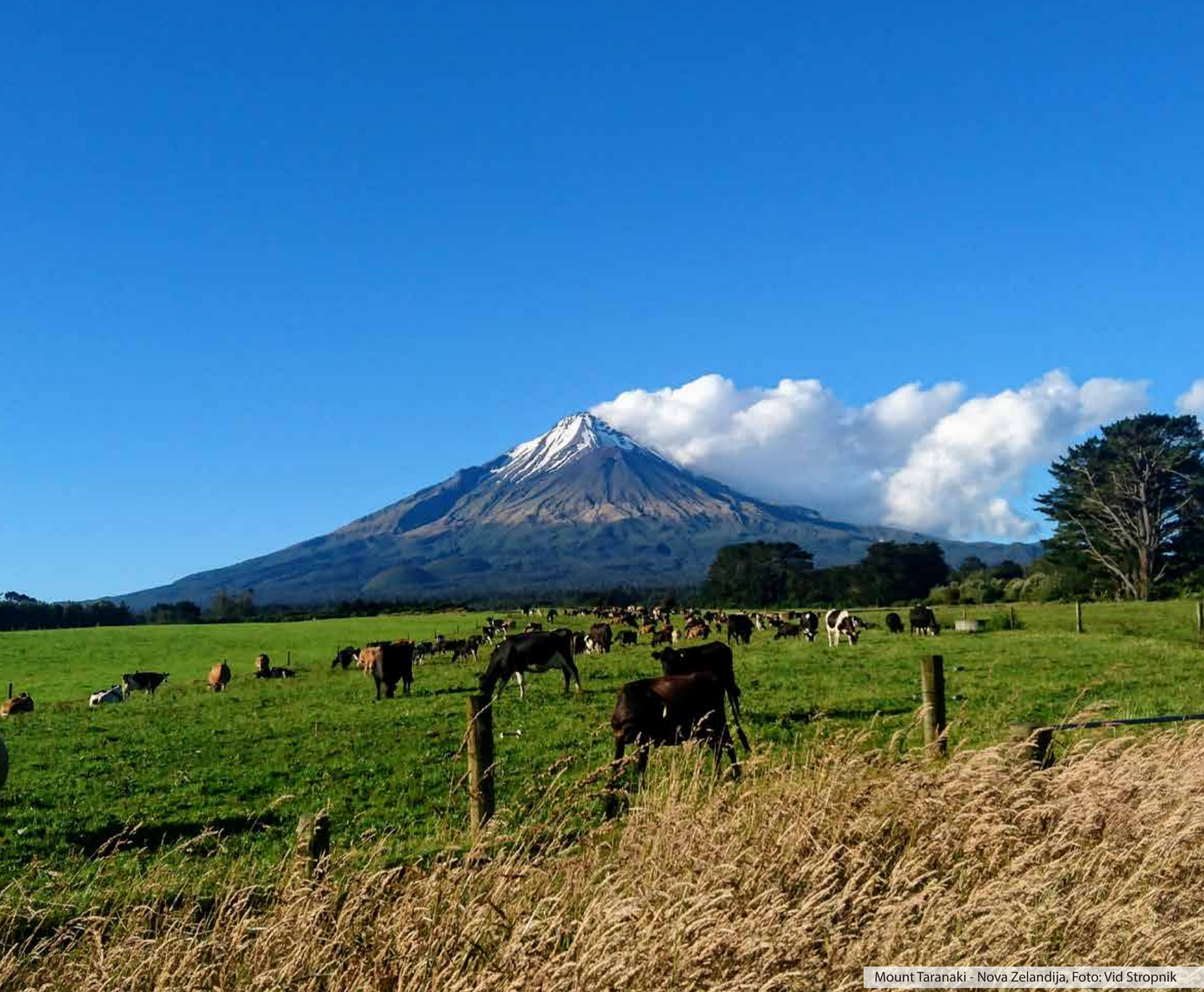
Mount Taranaki - Nova Zelandija, Foto: Vid Stropnik