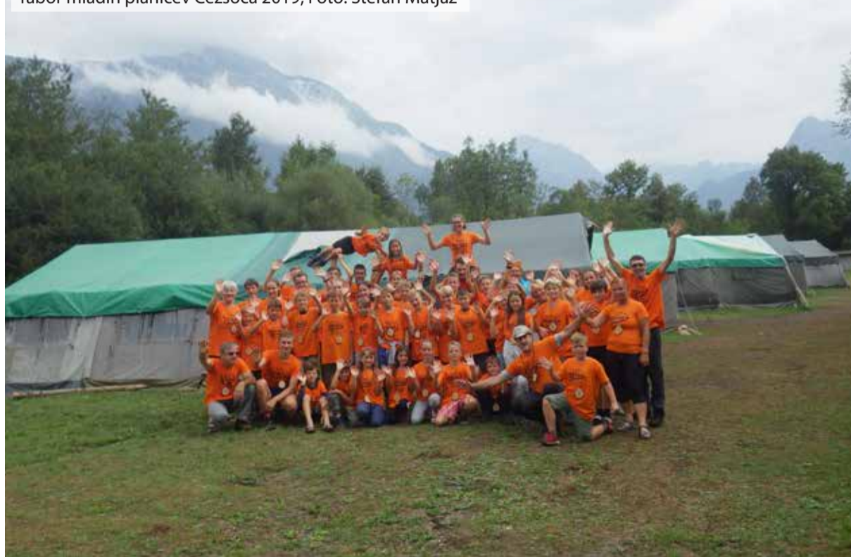
Tabor mladih planincev Čezsoča 2019