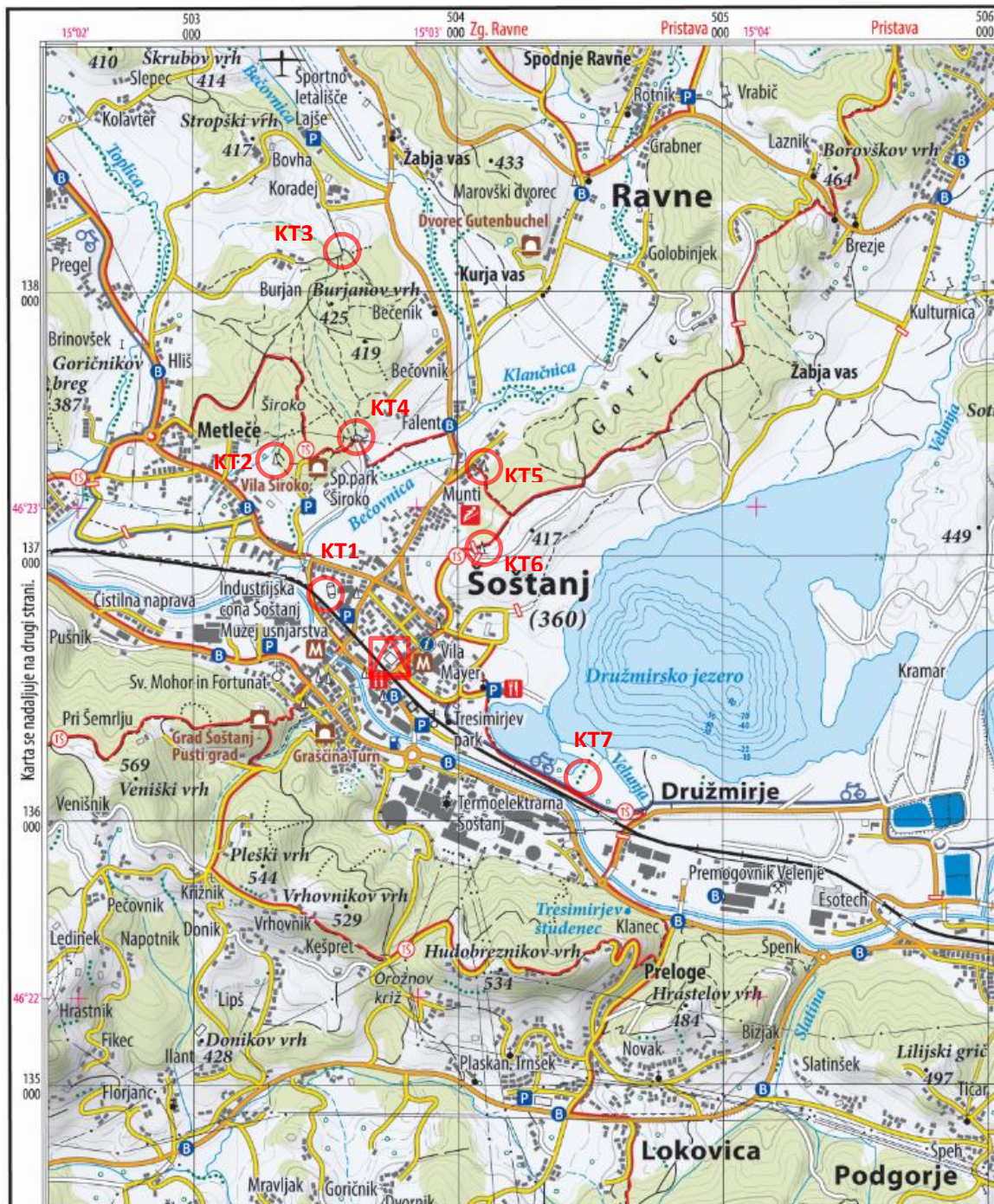
Planinska karta Smrekovec, Raduha, Olševa, Peca in Uršlja gora, PZS, 2021 Merilo: 1 : 25.000 (OPOMBA: večje merilo, kot je originalna karta) Ekvidistanca plastnic: 10 m