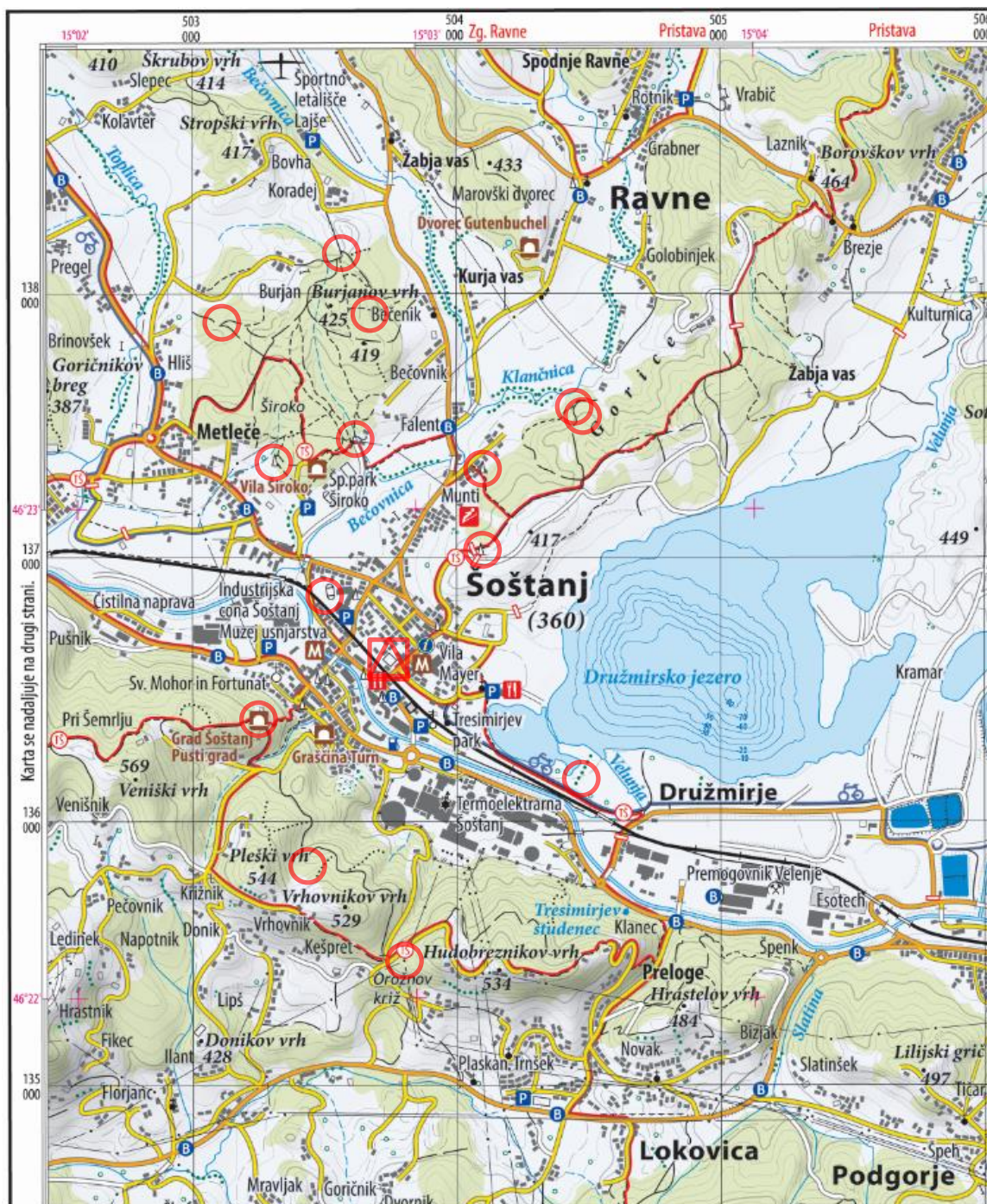
Planinska karta Smrekovec, Raduha, Olševa, Peca in Uršlja gora, PZS, 2021 Merilo: 1 : 25.000 (OPOMBA: večje merilo, kot je originalna karta) Ekvidistanca plastnic: 10 m